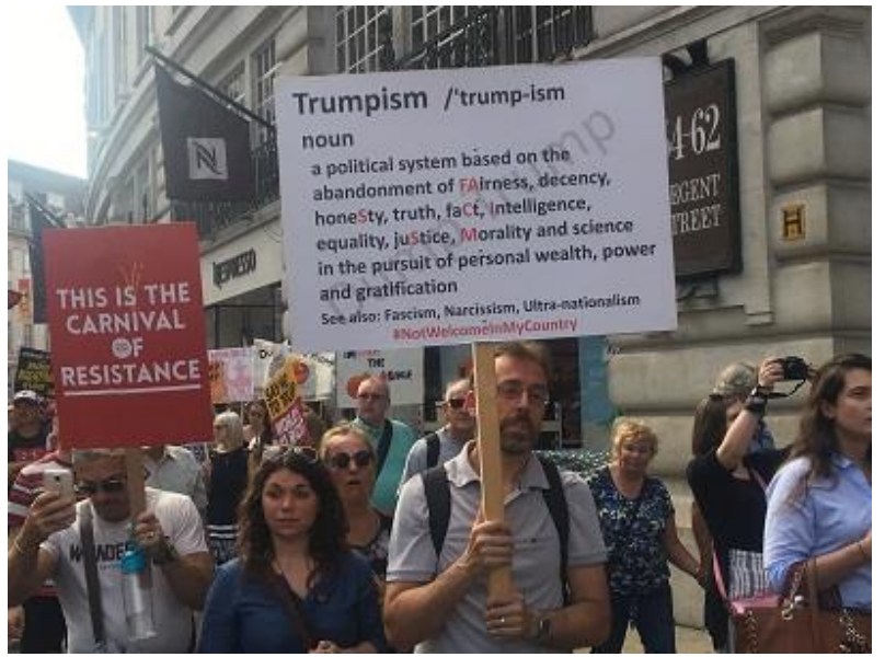
فعالين سازمان زنان هشت مارس (ايران-افغانستان)- لندن 13 ژوئيه 2018